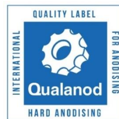
d) Etiqueta para el anodizado duro