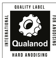
e) Ejemplo de la etiqueta de la marca en blanco y negro